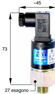
Esecuzione con connessione elettrica M2 Execution with M2 electric connection