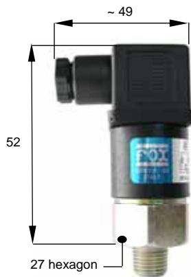
Esecuzione con connessione elettrica M3 Execution with M3 electric connection